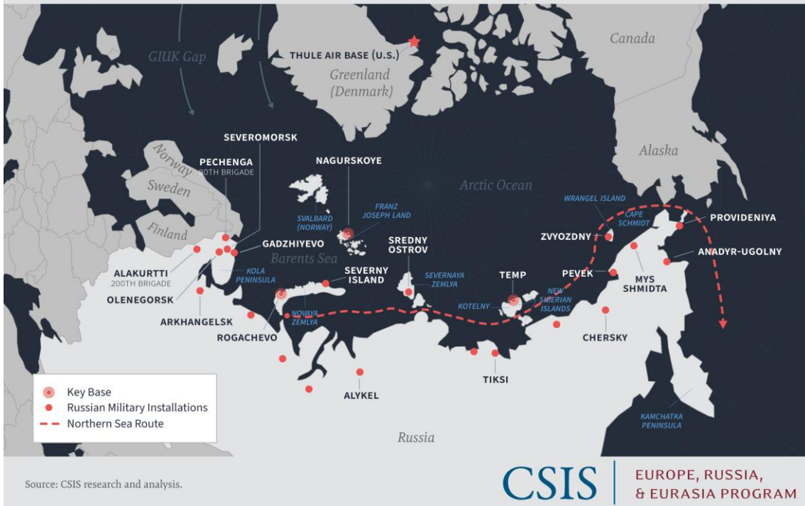
Figure 2: Russian Arctic Military Installations