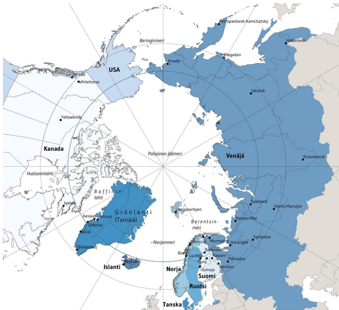
Kuva 1: Arktinen alue; Arto Vitikka, Arktinen keskus, Lapin yliopisto Rajojen lähde: Runfola, D. et al. (2020) geo Boundaries: A global database of political administrative boundaries. PLoS ONE 15(4): e0231866. https://doi.org/10.1371/journal.pone.0231866 .